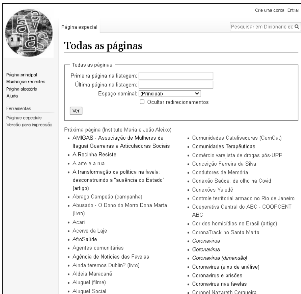
Figura 4 - Página inicial do sistema de busca da Wikifavelas